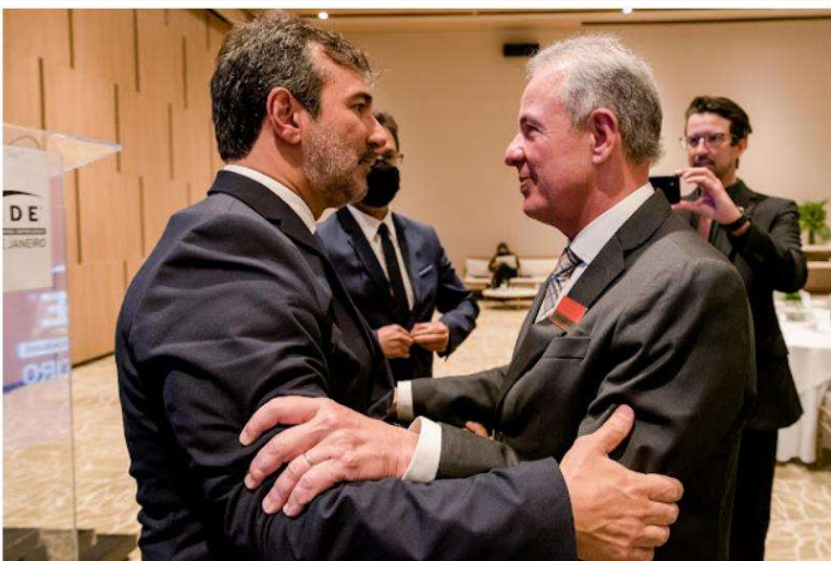
SECRETÁRIO DE DESENVOLVIMENTO ECONÔMICO, ENERGIA E RELAÇÕES INTERNACIONAIS E MINISTRO DE MINAS E ENERGIA BENTO ALBUQUERQUE