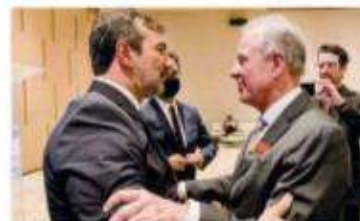
O secretário Vinicius Farah recebe o abraço do amigo e ministro Bento Albuquerque