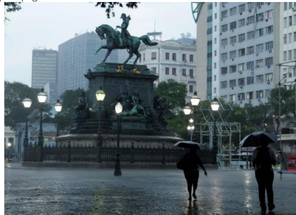
Praça Tiradentes, Centro do Rio: dificuldades financeiras do Estado levaram à falência econômica da capital fluminense nos últimos anos

O secretário afirmou ainda que o Estado não deve usar todo dinheiro obtido com a concessão dos três blocos da Companhia Estadual de Águas e Esgoto do Rio de Janeiro (Cedae) , que soma R$ 14 bilhões, para pagar a dívida do Estado.