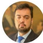
CLÁUDIO CASTRO Governador do Estado do Rio de Janeiro