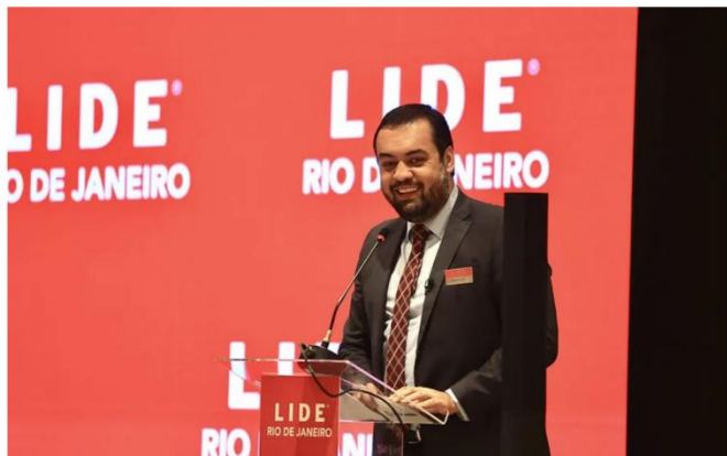
Cláudio Castro participa de evento da Lide em hotel em Copacabana

Após participar de almoço-debate promovido pelo Grupo de Líderes Empresariais (Lide), no Hotel Fairmont, em Copacabana, o governador Cláudio Castro garantiu que o serviço das barcas não será descontinuado. O contrato de concessão com a CCR Barcas termina neste sábado, e o acordo entre o estado e a operadora ainda não foi homologado pelo Tribunal de Justiça.